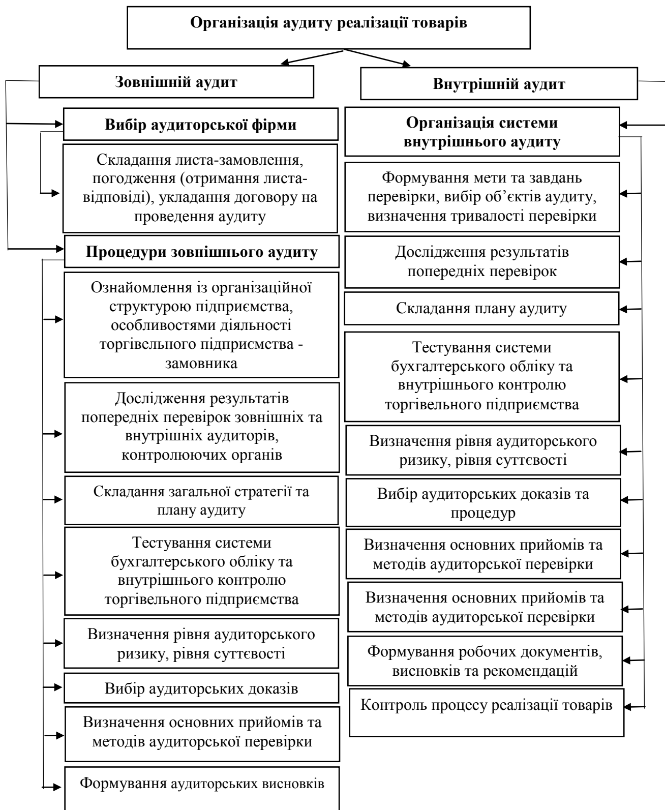
Рис. 2. Основні процедури організації аудиту товарних операцій