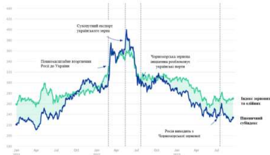
Рис.2. Індеси Міжнародної ради по зерну: зміни цін на зерно та пшеницю між січнем 2021 року та серпнем 2023 року

Ціни значно зросли приблизно в день вторгнення російської федерація в Україну і залишалися високими до травня 2022 року. Наприкінці травня були встановлені «смуги солідарності», і з цього моменту ціни почали падати. Чорноморська зернова ініціатива була запущена в липні 2022 року.