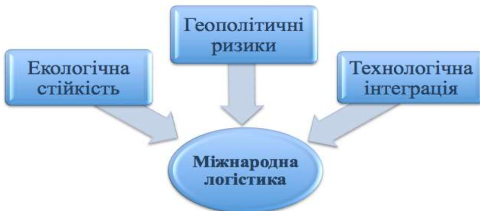
Рис. 3. Виклики в міжнародній логістиці

Виходячи вищевикладеного можемо окреслити головні виклики, що присутні сьогодні в міжнародній логістиці (рис. 3).