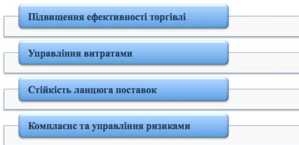
Рис. 1. Роль міжнародної логістики у зовнішньоторговельної діяльності підприємств

Роль міжнародної логістики у зовнішньоторговельної діяльності підприємств полягає у такому (рис.1).