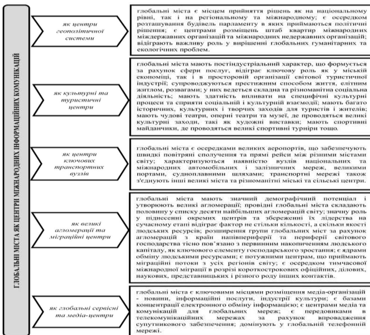
Рис. 3. Глобальні міста як центри міжнародних інформаційних комунікацій

Другою групою, що узагальнює функціональне значення глобальних міст, є їх значимість як центрів міжнародних інформаційних комунікацій. Центральними елементами глобальних економічних, політичних, соціальних і культурних гравців, проблем, структур і процесів стали міжнародна інформація та комунікація. Взаємозв'язок між технологічною еволюцією та економікою міжнародної комунікації, що розвивається, набуває центрального значення для аналізу міжнародної комунікації. Особливої актуальності в цьому контексті набуває вплив оцифрування на інформаційно-комунікаційні технології та пов'язані з ним процеси цифрового перетворення колись відокремлених медіа- та бізнес-секторів. У цьому контексті економічні та технологічні властивості міжнародних інформаційно-комунікаційних систем, що постійно розвиваються, а також економічні можливості/виклики, які вони створюють, також мотивують або змушують окремих осіб, підприємства, держави, а також міжнародні організації здійснювати структурні та політичні зміни для того, щоб скористатися потенційними перевагами міжнародної інформації та комунікації [14].